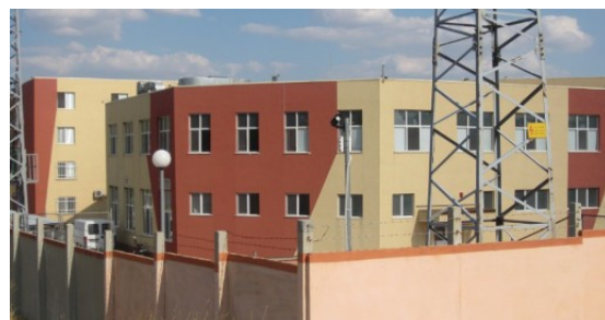
Transit Center Pastrogor

Die International Organisation of Migration (IOM) gab die Gesamtzahl der Migrant*innen und Flüchtlinge, die Bulgarien im Jahr 2015 erreichten, mit knapp 30.000 an 17 . Die SAR registrierte