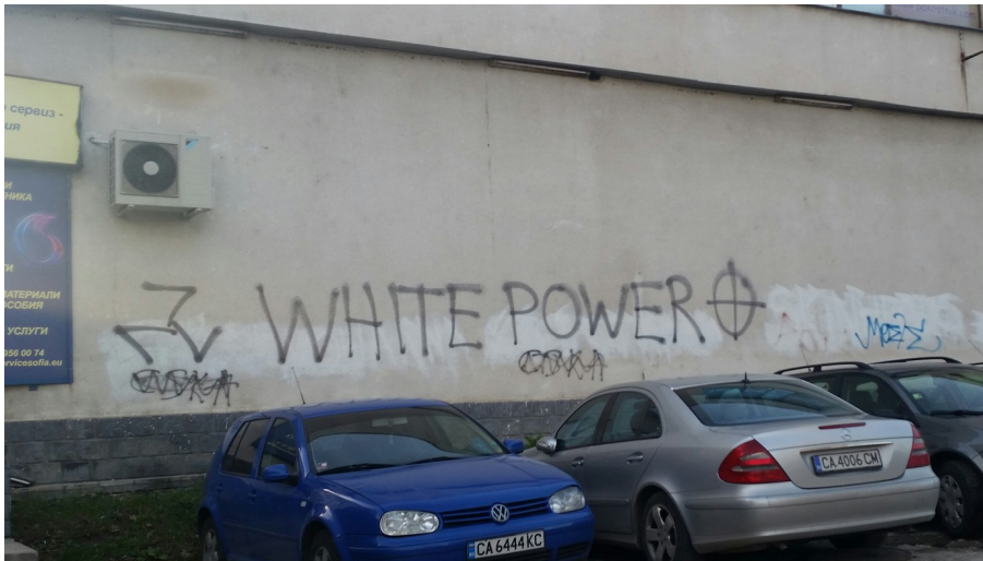
Neo-Nazi Graffiti in Ovcha Kupel

Aufschrei und nachdem eine Gruppe explizit den bulgarischen Premier mit Mord bedroht hatte, wurden einzelne Mitglieder der Gruppen kurzfristig festgenommen bzw. unter Hausarrest gestellt 76 .