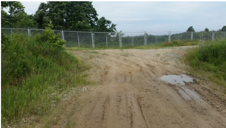
Alter“ Zaun, bulgarisch-türkische Grenze

Am 25. Februar 2016 beschloss das bulgarische Parlament, dass die Armee künftig an der Grenze eingesetzt werden kann 40 . Zuvor hatte die bulgarische Armee die das Innenministerium offiziell nur "logistisch" unterstützt. Die geplante Fertigstellung des neuen Zauns an der Türkisch-Bulgarischen Grenze zu Ende März 2016 konnte von den bulgarischen Behörden nicht eingehalten werden, weite Bauabschnitte sind immer noch nicht abgeschlossen. Die Unterstützung des Zaunbaus von ausländischen Politiker*innen ist zum Teil beachtlich. So wurden von Großbritanniens damaligen Premierminister David Cameron 40 Land Rover versprochen, um die bulgarisch-türkische Grenze zu sichern 41 . Kurz darauf besuchten die damalige österreichische Innenministerin Johanna Mikl-Leitner sowie der österreichische Verteidigungsminister Hans Peter Doskozil die bulgarisch-türkische Grenze. Vor Ort sicherten beide den bulgarischen Behörden personelle, als auch Sachmittelunterstützung zu, wie zum Beispiel Nachtsichtgeräte. Mikl-Leitner sprach ein paar Tage später im Fernsehsender ORF über ein "neues Potential der Ostbalkanroute", die ihrer Meinung nach bis zu über eine Million Menschen nutzen könnten. Bereits vorher hatte sich der bayerische Ministerpräsident, Horst Seehofer, die europäische Außengrenze in Bulgarien angesehen und verband in einem Statement Wirtschaftshilfe direkt mit Grenzsicherung 42 .