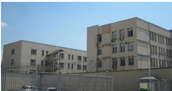
Detentioncenter in Busmantsi

Misshandlungen durch die bulgarische Polizei, unter anderem in Isolationszellen 26 . Der Organisation Center for Legal Aid - Voice in Bulgaria (CLA) zufolge wurden laut dem bulgarischen Innenministerium im Jahr 2015 in den Abschiebegefängnissen Lyubimets und Busmantsi 11.902 Personen festgehalten 27 . Die bulgarische Ombudsfrau, Maja Manolowa, veröffentlichte im März 2016 einen Bericht, wonach unbegleitete minderjährige Flüchtlinge (umF) gemeinsam mit Erwachsenen Menschen inhaftiert werden 28 . Im Jahr 2015 waren 2.523 umF in den beiden Abschiebegefängnissen untergebracht 29 . Eine bereits Ende des Jahres 2015 eingeführte Regelung sieht vor, dass Asylsuchende auch ohne Interview abgelehnt werden können 30 . Die Rechtsexpertin Radostina Pavlova, vom CLA warnte davor, dass dadurch die Anzahl derjenigen steigen werde, deren Asylgesuch abgelehnt wird und welche anschließend in Abschiebehaft landen 31 .